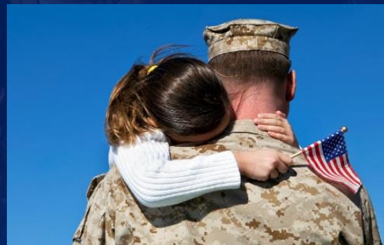
在服役家人驻外参军时 照料其他家庭成员